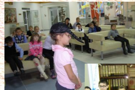
3«Б» в музее

Округ – наш дом, Мы в нем живём, Это кусочек России, Всё сохраним и бережём, Ведь на то он наш дом! 10 декабря наш округ отметил свой день рождения. Мы всем 3 «Б» отправились на экскурсию в городской музей. Нам рассказали о творчестве бабушки Анне. Это писательница, которая написала огромное количество сказок. Мы познакомились с содержанием некоторых из них. Нам очень понравилась эта экскурсия, мы узнали много нового и интересного. А по итогам мы выпустили проект «Округ – наш дом».