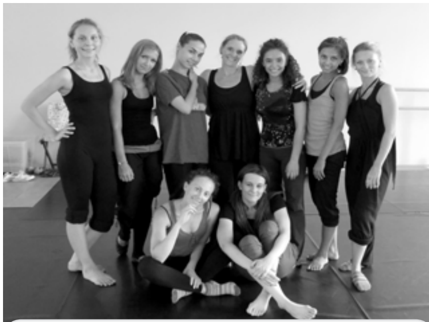
«Работницы» ЦЕХа

Я была первопроходцем из Находки, так как еще никто до меня, по крайней мере, из нашей студии, не ездил на Летнюю школу. В Интернете на сайте www.tsekh.ru я нашла всю нужную для меня информацию, подала заявку на два курса занятий и оплатила их также онлайн. Взяла только два курса на пробу, так как первый раз, думала, что не потяну программу. Но, оказавшись в Москве, в студии, я поняла, что я ничем не хуже остальных учеников школы. Занималась наравне с