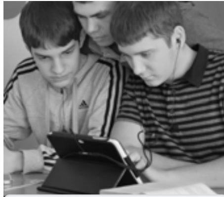
Гаджеты порой так нужны на уроке

А теперь возьмём, к примеру, современный сотовый телефон. Да, он полезен всеми своими функциями. Аудиоплеер, видео, различные виды общения, диктофон, ежедневник, игры – и всё это в одной маленькой штучке. А если их разделить на разные устройства, то, возможно, всё и в дамскую сумочку не поместится. Тот факт, что телефон имеет вредное излучение для человеческого организма, никому не интересен. Ведь много функций это так