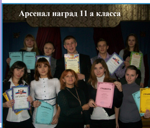
Арсенал наград 11 а класса

Поздравляем учителей, работников школы, учеников и их родителей с наступающим Новым годом!