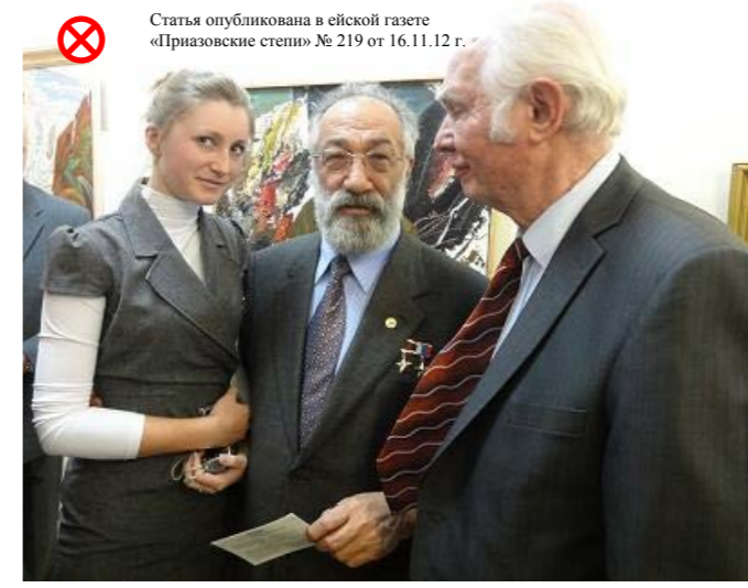
Статья опубликована в ейской газете «Приазовские степи» № 219 от 16.11.12 г.