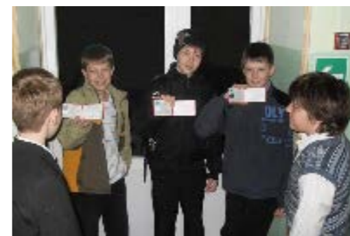
Стоять! Показываем ученические билеты...