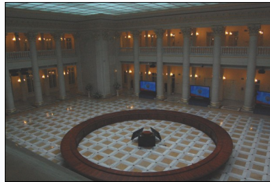
Президентская библиотека им. Ельцина