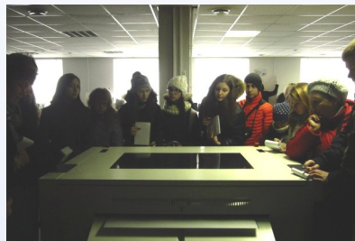
Образцовая типография Автор: Марина Рунович