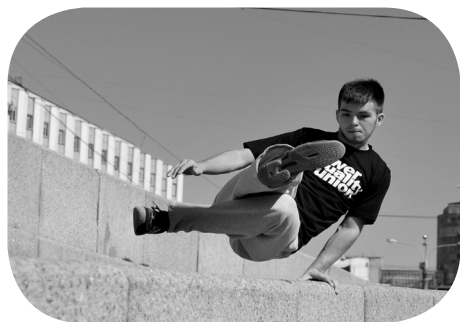
Parkour в фокусе