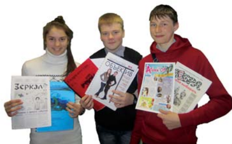
Фото Виктории Бадзюры