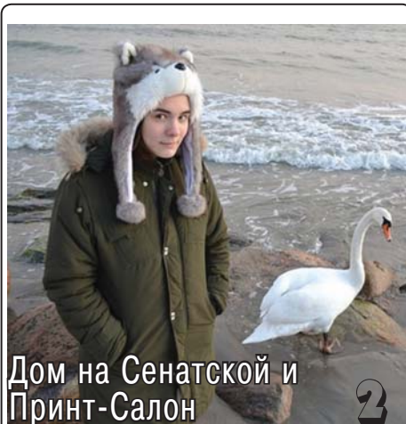
Дом на Сенатской и Принт-Салон

Тема конкурса: «В фокусе: Питер, конкурс и Я»