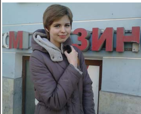
О самом главном