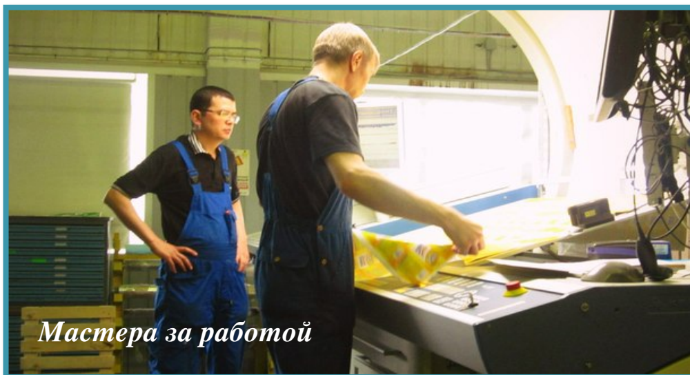
Мастера за работой