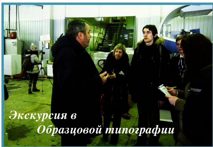
Экскурсия в Образцовой типографии

После церемонии открытия в рамках конкурса всем участникам представилась возможность посетить множество интересных мест Петербурга. В зависимости от собственных предпочтений конкурсанты заранее выбирали между Президентской библио-текой им.Б.Н.Ельцина, Принт-салонем, радио «Балтика», Медиа Центром СЗИП и Образцовой типографией.