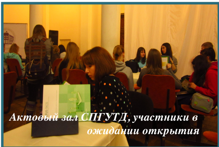
Актовый зал СПГУТД, участники в ожидании открытия

23 марта в актовом зале Санкт-Петербургского Государственного Университета технологии и дизайна состоялось торжественное открытие очного этапа XV Всероссийского конкурса «Издательская деятельность в школе», организованного