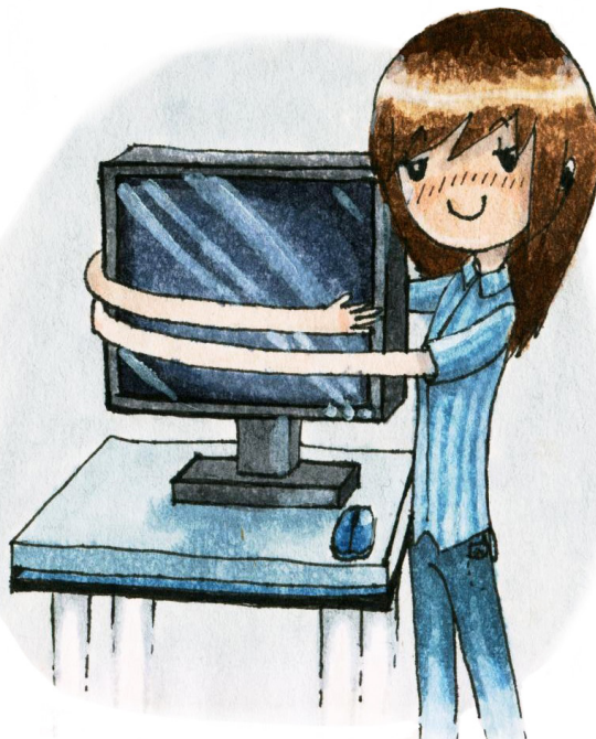
Рисунок Анастасии Самсоновой

сколько человек, живущих в развитых странах, проводят такие "нерабочие" дни хотя бы раз в год. Но вот можем ли мы в нашем веке жить без постоянного потока информации, как жили двести лет назад? Станем ли мы на самом деле больше общаться вживую, если лишимся доступа к Интернету? Насколько действительно привязано наше поколение к «новомодным» гаджетам и как эта зависимость изменяется с возрастом? Корреспонденты «Уна-Life» в возрасте от 11 лет до 21 года проверили это на себе. В течение 24 часов испытуемые не должны были пользоваться мобильником, телевизором, плеером и компью-