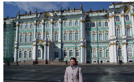
НА ЭТИХ УЛИЦАХ МЫ БРАЛИ ИНТЕРВЬЮ