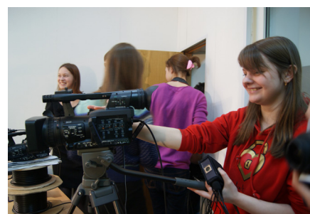
ВСЕ СЕКРЕТЫ ВИДЕОСЪЕМКИ