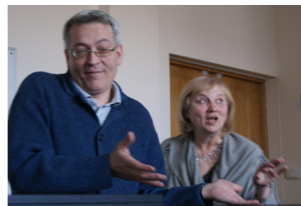
НАШИ ЭМОЦИОНАЛЬНЫЕ ПЕДАГОГИ