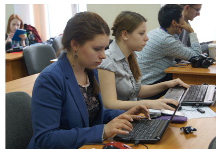
ТАК РОЖДАЕТСЯ ГАЗЕТА