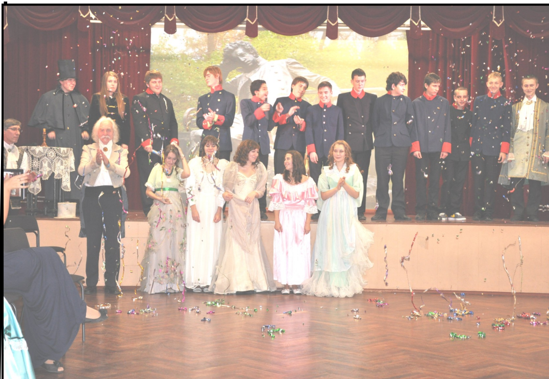
День Лицея. 19 октября 2012 года. Спектакль.