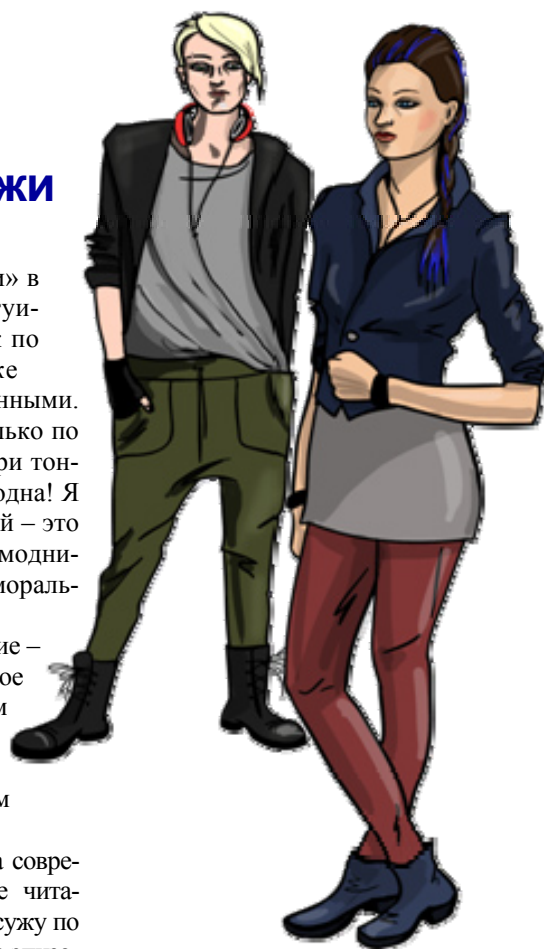
Рисунок Надежды Пророковой, завинфотекской

Хомо Сапиенс современности не так уж и многим отличается от многих предшествующих ему поколений, однако есть моменты, которые определяют его как представителя нашего с вами времени. Короткая стрижка нынче в моде, длинные волосы оставьте девушкам и субкультурным