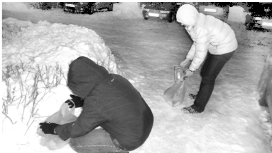
И мы решили пойти почистить город...