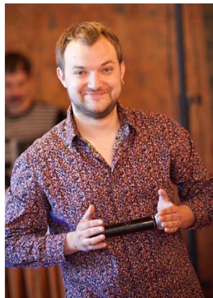
«Улыбаемся и машем!»