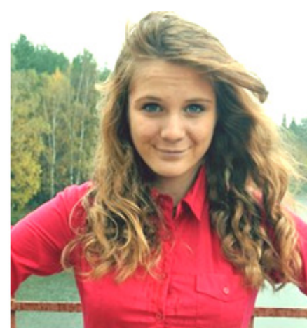
Фото из архива Марии Алексы, 10Б

– Человеку надо жить сегодняшним днем, ценить каждое мгновение своей жизни. Прошлое уже не вернуть, будущее пока еще не наступило.