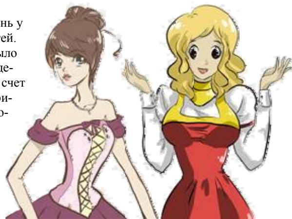
Что такое мода?

Определенная подростковая мода отсутствовала во всех сословиях: у крестьян – взрослый сарафан или рубаха, у купцов – кафтан, у дворянских отпрысков – фрак и платья с корсетами.