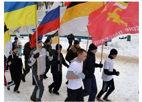
Веселым маршем на разминку

«Ощущения просто отличные, дух товарищества оставляет только положительные эмоции. Эта акция носит агитационный характер, мы хотим привлечь внимание к проблеме пьянства