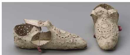
«Коровьи морды» (Италия, 1605 г.)

2. В XV веке туфли стали удобнее за счет того, что изменились, став короче и шире (такие модели называют «коровьи морды»). Вместе с модой на многочисленные разрезы в костюме, вошли в моду «медвежьи лапы» – туфли из цветной кожи или бархата, без каблуков, с широкими носами, модными в середине XVI столетия.