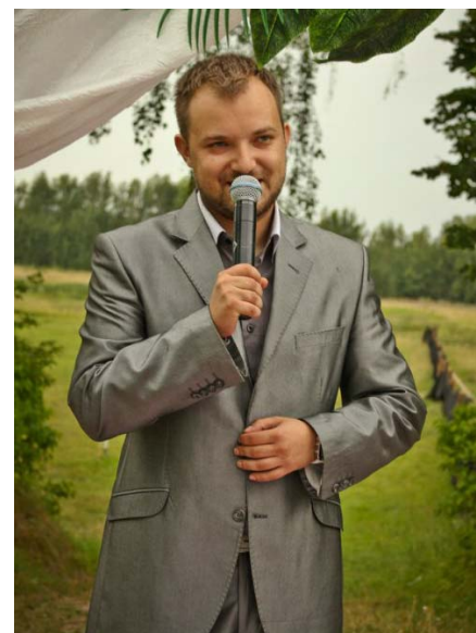
Закончив филфак, всегда знаешь, что и как сказать