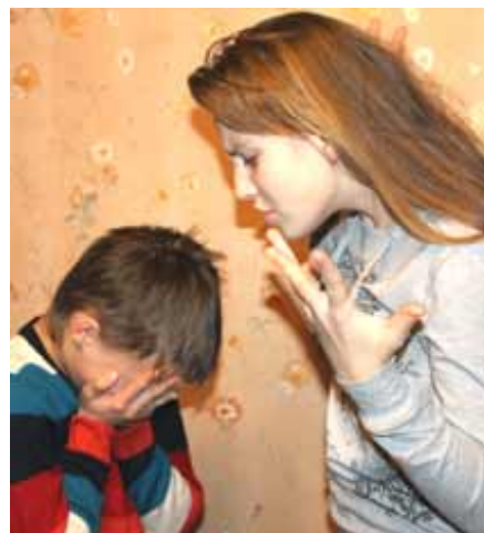
Ты только и умеешь трепать всем нервы!