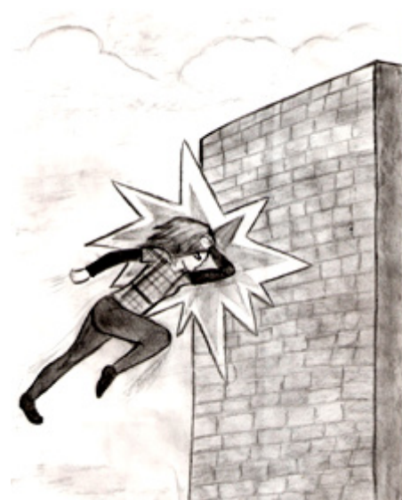
Рисунок Светланы Дивейкиной, 9Б

Дорогие взрослые, помогите этого избежать. Дайте понять подростку, что он нужен. Что ему помогут в любом случае, независимо от того, какую