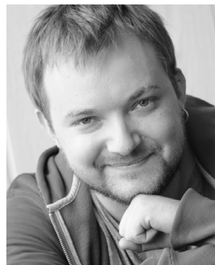
А знаете, о чем я подумал?