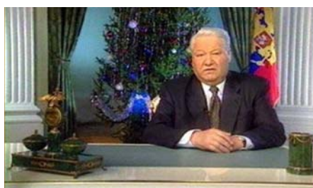
Объявление об отставке Б. Ельцина

5. В канун 2000 года, когда Б. Н. Ельцин объявил о своей отставке, он назвал 1999 год «последним годом столетия и тысячелетия», хотя это не так – последний год столетия и тысячелетия – 2000-й.