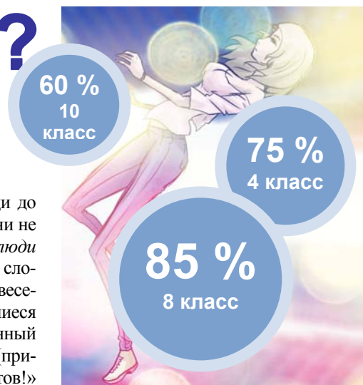
Диаграмма «Быть молодым легко!»

« Что такое молодость? » – спросили мы у десятиклассников. Ответы прямо-таки кричали: «Самая чудесная пора в жизни, первая любовь, самые запоминающиеся события!» (50 %). Оставшаяся половина старшеклассников оказалась анархистами: