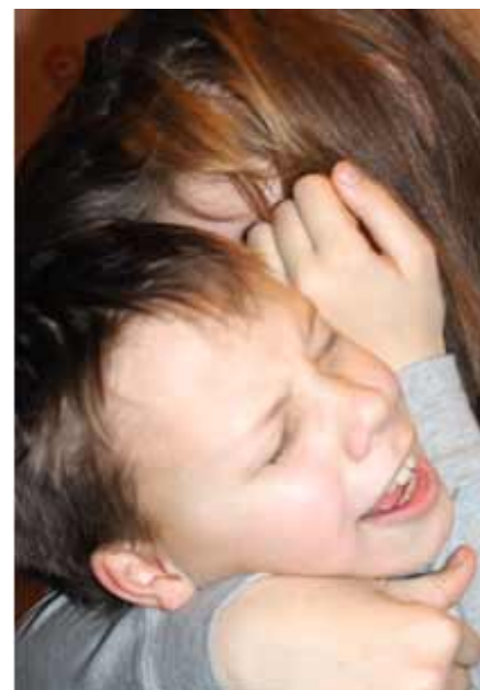
– Мы с тобой оба неправильно поступили...