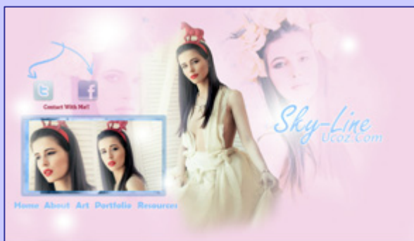
Страничка дизайн-студии «Sky-Line»