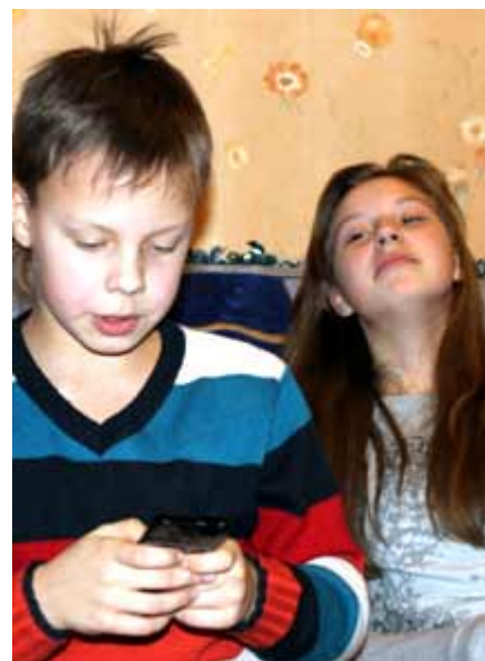
«Ко-те-нок при-ве-тик...» Ахаха!