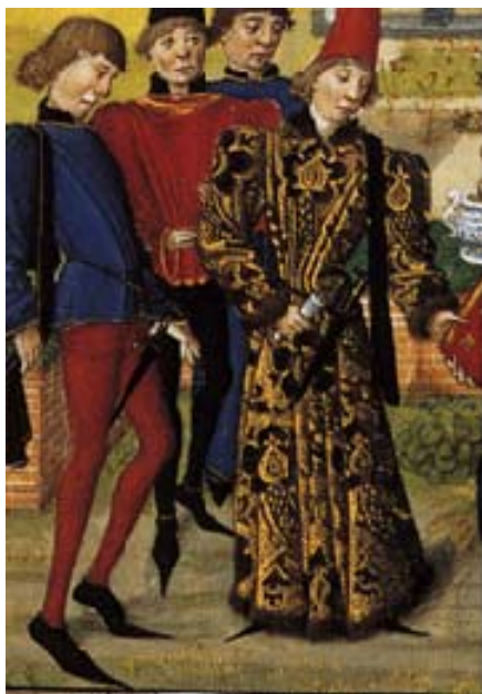
Пулены в Средневековье

1. В эпоху Средневековья были особенно популярны пулены – туфли с длинными, загнутыми вверх носами, которые часто украшались колокольчиками или бубенцами. Французский король Филипп IV даже издал специальный закон, согласно которому вся знать должна была носить только такую обувь. В XIV веке длина туфель демонстрировала знатность их владельца: нос туфель возрастал по длине в зависимости от ранга. Чтобы ходить было удобно, и не спотыкаться об очень длинные носы привязывали загнутый кончик туфли к ноге бечевкой. Такая форма носов туфель сохранилась даже в доспехах.