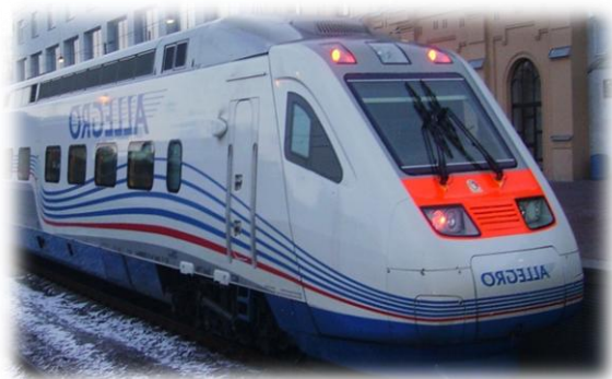
«14 экспресс» покидает Санкт-Петербург

Жители Санкт-Петербурга бегут вперёд, стремясь прожить свою жизнь так, чтобы ни о чём не пожалеть, и большую часть этого стремительного потока занимает молодёжь. Это те юноши и девушки, которые стоят в самом начале своего жизненного пути. Они ещё не знают, что ждёт их в будущем, но верят в то, что оно будет светлым.