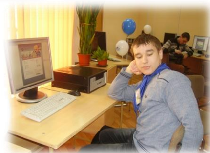
Мастер-класс. Schoolizdat in the city.