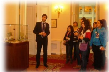
Конкурсанты внимательно слушают экскурсовода

Небольшие неприятности, такие, как плохая погода и долгая проверка службой охраны, ни капли не остудили пыл участников конкурса. Когда проверка была пройдена, а куртки сданы в гардероб, началось удивительное путешествие по библиотеке.