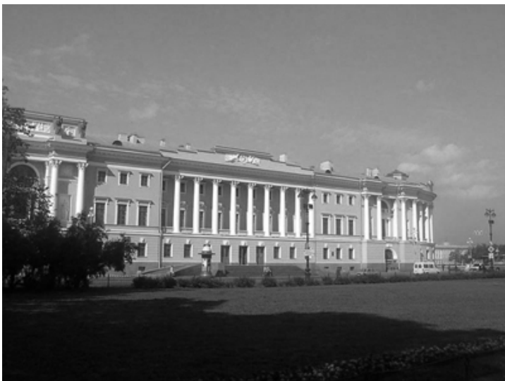
Здание Президентской библиотеки

Одной из самых интересных экскурсий была поездка в медиацентр СЗИП. Мы встретились со специалистами, которые работают в телевизионной сфере. Каждый начинающий журналист мог задать им вопросы и получить интересные ответы. Также мы смогли присутствовать на самом «шоу». Для нас эта экскурсия стала стимулом для того, чтобы начать снимать и свои репортажи.