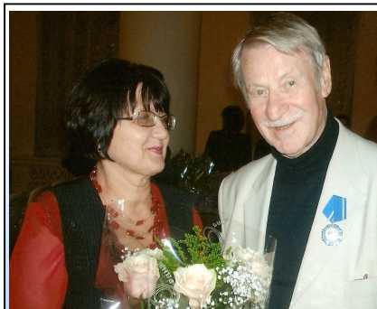
Поздравления от Народного артиста России И. И. Краско

Хайям: Какую вы музыку предпочитаете слушать?