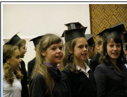
Посвящение в математики

Осень вообще оказалась богатой на события: 29 сентября прошло посвящение 5 а и 5 в классов в математики, а 22 октября – посвящение 5б в хими-