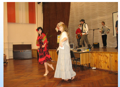
Группа «СВОБОДА» и танец девочек, 10 класс

могу сказать: взрывное, весёлое, задорное выступление понравилось многим нашим зрителям, и они ничуть не пожалели, что пришли на День Украинской Культуры! А некоторых это вы-