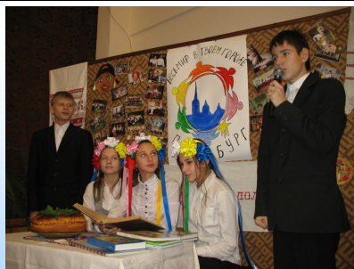
«Вечер накануне Ивана Купала», 7 класс

В долгожданном выпуске нашей газеты, дорогие читатели, с удовольствием хочу рассказать вам о празднике «День Украинской Культуры», который прошёл 19 ноября у нас в школе. От всех выступлений, которые я видел и в которых принимал участие, этот праздник отличался своей про-