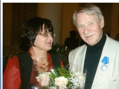
Заслуженный Учитель РФ

С уважением, Главный Редактор газеты «ВТеме.ру»