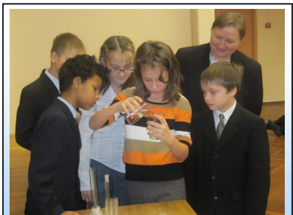
Посвящение в химики-биологи

Кроме посвящений, 5-е классы уже 4-й месяц участвуют в интеллектуальной игре «Умный совок». Прошли туры по следующим предме-