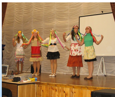
Украинский танец, 6 класс