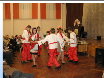
День Украинской культуры