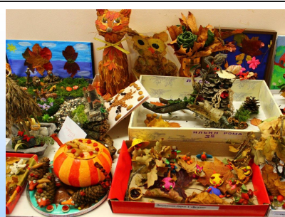
Конкурс «Мир вокруг нас»