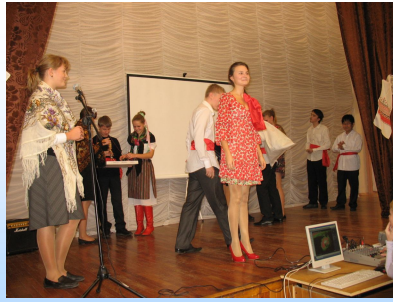
«Вечера на хуторе близ Диканьки», 9 класс