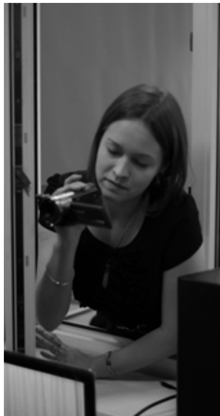
Я всегда с собой беру ВИДЕОКАМЕРУ