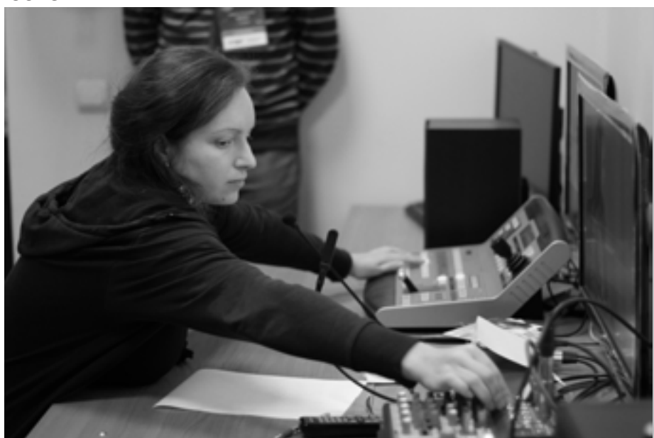
На кнопки рук не хватает!

Как течет жизнь в ВУЗе, и какая там царит атмосфера – это большие вопросы и совершенно неизвестно, как найти на них ответы. Вот лично мы думаем, что там всегда рабочая атмосфера; проходят интересные лекции; студенты, работающие в командах. Но одними нами мир не ограничивается, поэтому мы решили отправить нашего фотографа Эдуарда КСЕНИЧА, чтобы он показал конкурс изнутри – сквозь объектив.