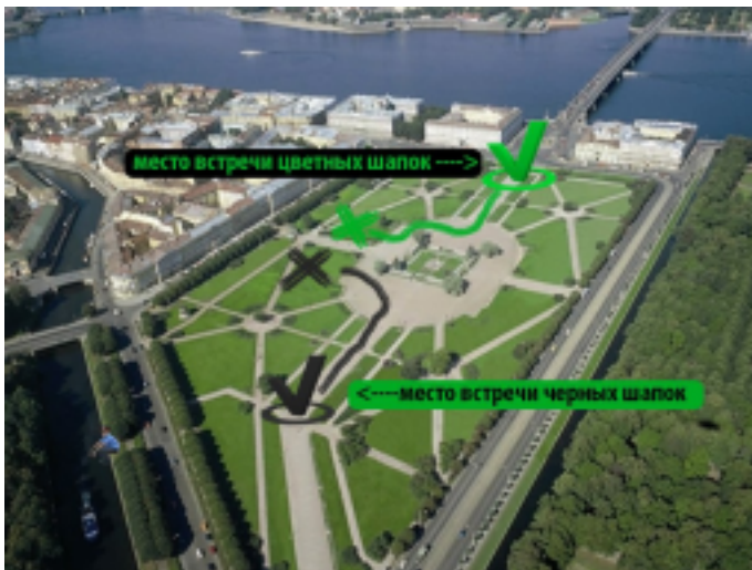
План битвы (вверху)