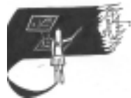
Сбор участников битвы (справа)