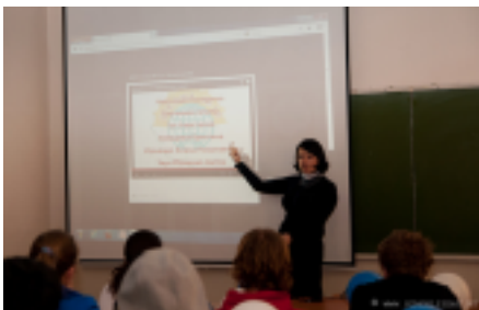
Фотография с мастер-класса, взята с сайта schoolizdat.ru

новостного видеоролика. (экскурсия в СЗИПе на кафедре журналистики и медиа технологий СМИ). Одна из самых больших возможностей, предоставляемых организаторами конкурса, даже не участие, а возможность пообщаться с другими начинающими журналистами, поделиться опытом. В прошлом году мне удалось познакомиться с главным редактором школьной газеты Выборга, в этом – пообщаться с ребятами из Калининграда.