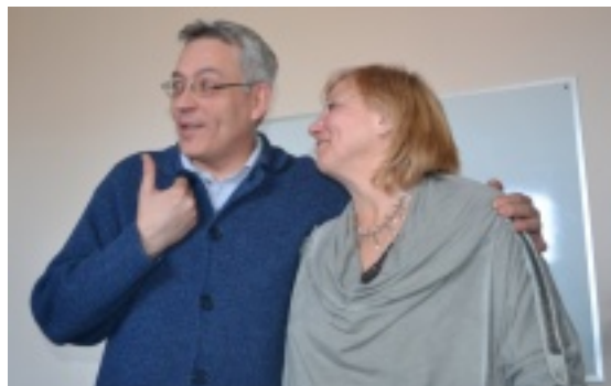
Живые легенды журналистики

Великолепно же мгновение, когда мы можем наблюдать, как студентов привидения ищут время, чтоб поспать.