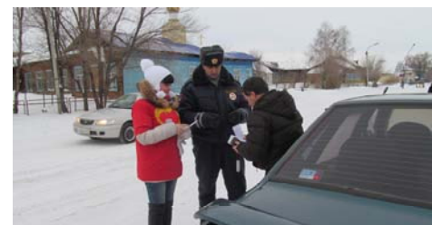
Акция «Безопасная дорога детям»

Ежегодно взамен уходящих выпускников отряд пополняется девятидесятиклассниками. Основным условием участия в движении является: желание делать Добро, не курить, отрицательное отношение к наркотикам и готовность пропагандировать здоровый и активный образ жизни.