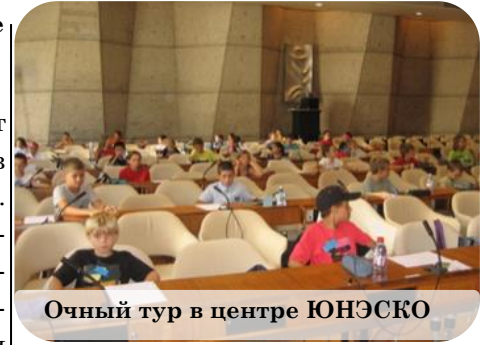
Очный тур в центре ЮНЭСКО

городской математической олимпиаде. Прошел 2 заочных тура и попал на 3-ий очный. Очень сомневался в своих силах, волновался, но с радостью узнал, что поеду в Париж на заключительный чемпионат юных математиков. Мне очень понравилось в Париже, все дома: современные и старинные, гармонично сочетаются. И город выглядит единым целым. Мы много где побывали и многое повидали.