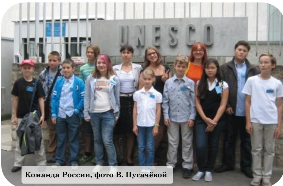
Команда России