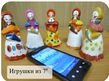
Игрушки из 7 а

Молодёжь — это особая возрастная группа, отличающаяся возрастными рамками и своим статусом в обществе: переход от детства и юности к социальной ответственности.