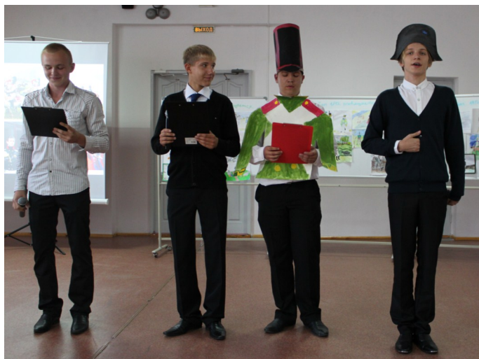
Заключительное мероприятие Года истории