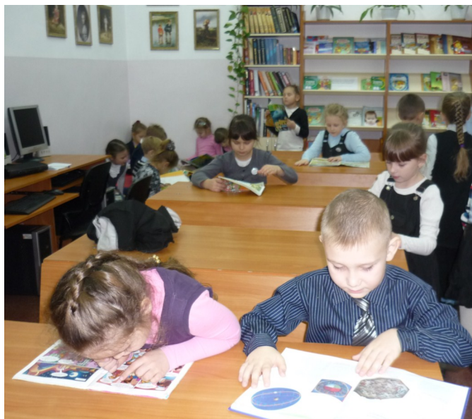
Ты смотри, как интересно! Все на свете нам известно...