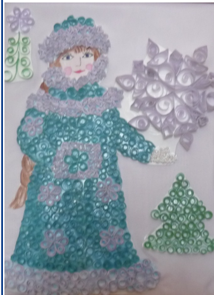
«Девочка-Снегурочка». Коллективная работа учащихся 2 А и 2 Б класса