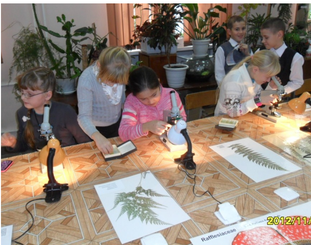
Бактерии крупным планом

музей АГУ, увидели чучела животных и морских обитателей. Студенты университета показали презентацию об обитателях моря. А как интересно было рассматривать в микроскоп цветы и бактерии в пробирках!