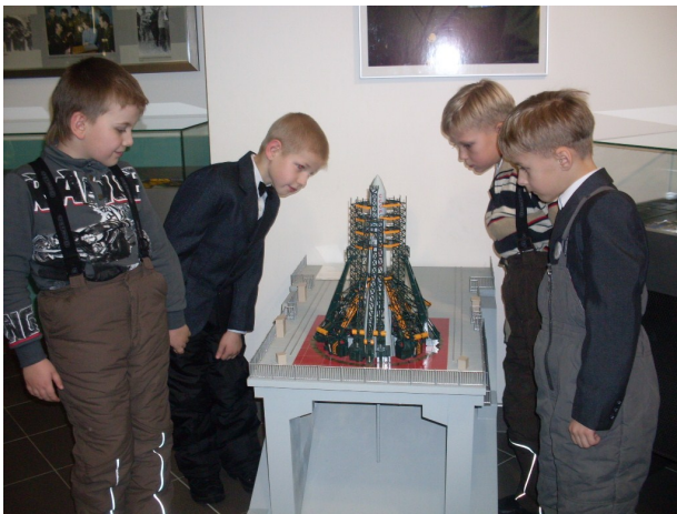
Модель настоящей ракеты

2 декабря 2012 г. учащиеся 1 А класса совершили увлекательное путешествие в Краевой театр кукол «Сказка», они посмотрели замечательный спектакль «Звездный мальчик». Путешествие первоклассников на этом не закончилось. Затем они побывали в с.Полковниково, на родине летчика-космонавта №2 Г.С.Титова. Узнали много нового и интересного о самом космонавте, о космических станциях, увидели космическую еду. Получили большое удовольствие от поездки и массу впечатлений.