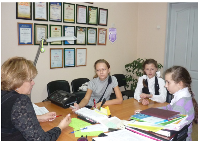
Интервью с директором лицея