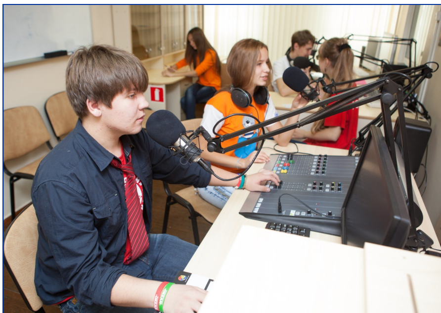
Ура! Я - в эфире!