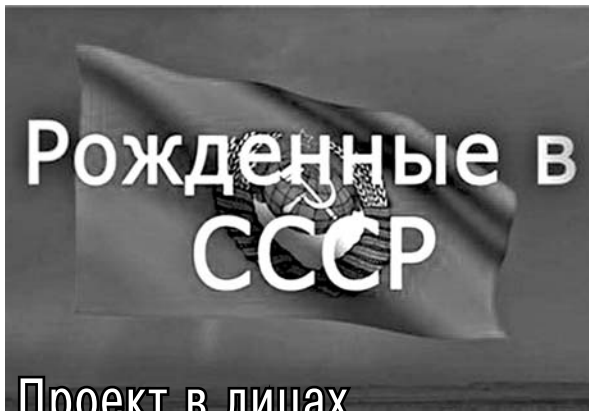
Рожденные в СССР