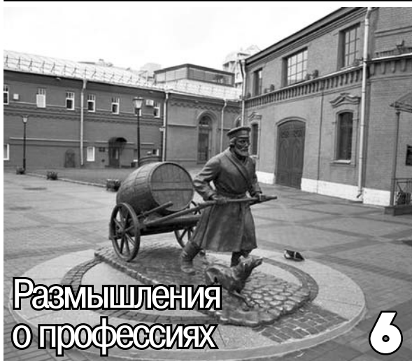
Размышления о профессиях