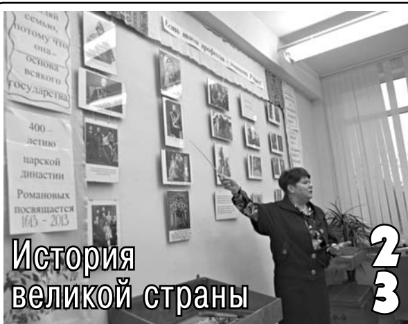
История великой страны