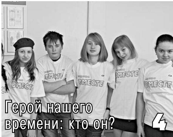
Герой нашего времени: кто он?