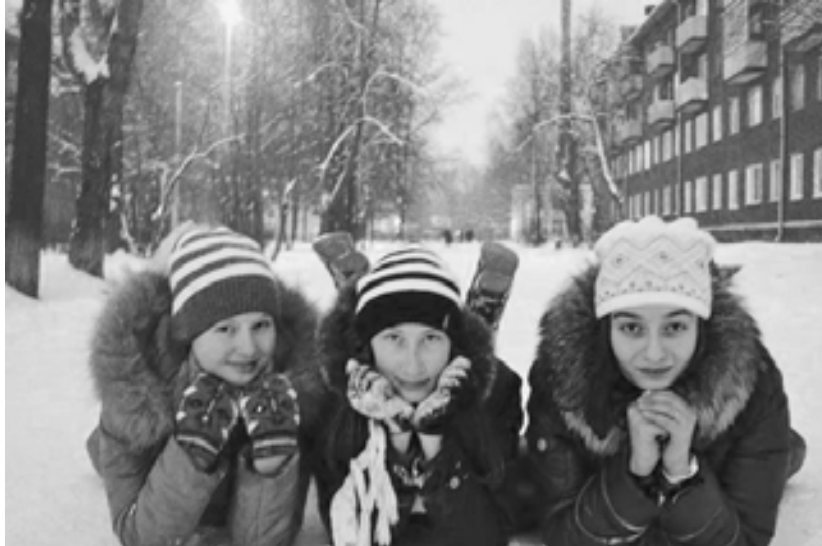
Мои друзья - моя ежедневная радость!

Говорить, насколько велико значение этих людей в нашей жизни, не приходится. Все об этом и так знают. Для меня же друзья – это часть семьи, люди, которым я могу доверять всегда и несмотря ни на что. Горе с ними можно разделить пополам, радость — удвоить. Никогда не понимала людей, стремящихся иметь сто друзей, но при этом не стремящихся завязать с ними по-настоящему теплые отношения. Что в этом хорошего? По-моему, лучше иметь несколько человек, которые станут для вас близкими и родными.