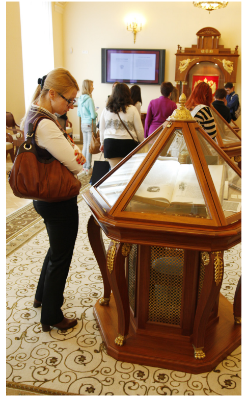
Каждый экспонат достоин внимания

Это действительно очень интересно. Более того, впервые проходя фэйс-контроль, чтобы попасть в здание библиотеки, никто не может и предположить, что здесь, за этими стенами, не только собраны самые ценные книги по истории России, но и начинается новый мир, с новым визуальным восприятием. За гранью фантастики.