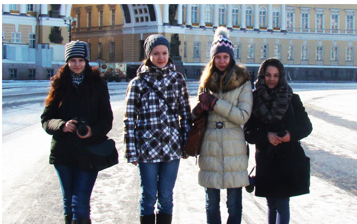
Под впечатлением от Санкт-Петербурга