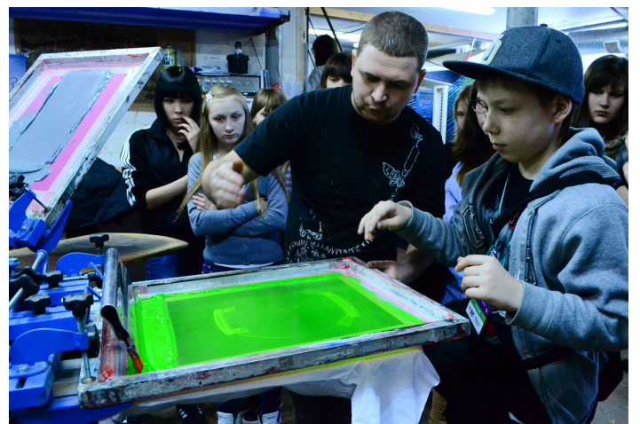
Под чутким руководством профессионала

Принт-салон представляет собой небольшое помещение, к которому ведёт длинный освещённый лампами накаливания коридор. Войдя, ощущаешь себя как будто в каком-то секретном бункере – даже двери металлические, обитые алюминиевыми листами. В ней находятся два карусельных станка с плёнками с будущим рисунком, столиками для натягива-